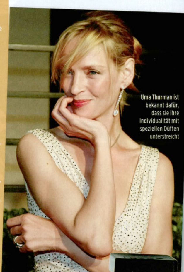
Uma Thurman ist bekannt dafür, dass sie ihre Individualität mit speziellen Düften unterstreicht

10 Verwandt „Clemency“ widmeten Humiecki & Graef allen Müttern. Die Duftnuancen wirken sehr feminin. 100 ml EdT, ca. 149 Euro, www.humiecki-andgraef.com